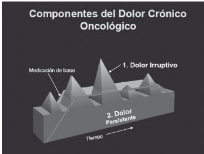
Fig. 1. Dolor irruptivo.